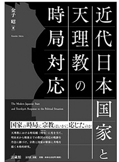
『近代日本国家と天理教の時局対応』 カバー表紙

本書は昨年 2025（令和 7）年 12 月に刊行された。この年は戦後 80 年目の節目の年でもあった。そして本年 1 月 26 日には、天理教は教祖 140 年祭の「時旬」を迎えた。戦後の日本は、民主主義体制の下で平和国家として歩んできた。終戦直後の 1946（昭和 21）年の教祖 60 年祭以降、今日まで教祖の年祭を平和の裡に賑やかに執行してきた。平和な「時局」があってこそ、「時旬」を平和に迎えられる。我々は、激動の時代の天理教教団史を振り返り、そこから学んでこそ、この貴重な歴史的教訓を汲み取ることができるのである。