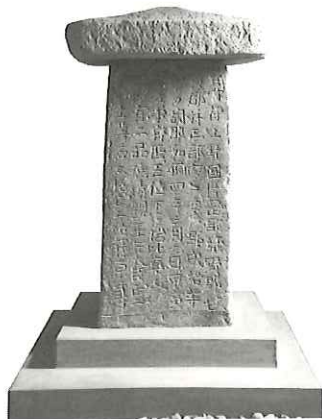
写真1 多胡碑

「新発見考古速報」のなかで、とくに興味深かったのが史跡上野国多胡郡正倉跡(群馬県高崎市)だ。この遺跡は、利根川の支流、鏑川が切り開いた広大な谷の中にあり、かねてから郡衙が存在すると想定されていた。平成23年(2011年)からの発掘調査で、ひときわ高い段丘上の場所から、東西16.8m、南北7.2mの大型建物跡が礎石が整然と並んだ状態で発見され、炭化米や多量の瓦が出土したことから、正倉(税として徴収した稲を保管する倉庫)の中でも格式の高い「法倉」だと考えられた。出土遺物から見ると正倉の創建年代は8世紀前半で、律令国家の税の徴収や地方支配の在り方を考える上で重要であるとして、令和2年(2020年)3月、国の史跡に指定された。巡回展の会場では、正倉跡の出土遺物のほか、正倉跡の北方約350mに位置する多胡碑の実物大模型が展示されていた。