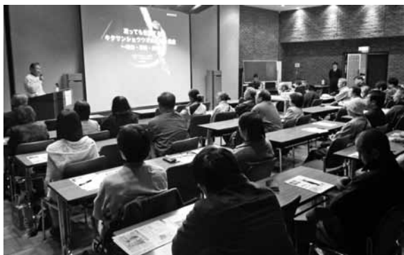
写真2 釧路市立博物館でキタサンショウウオについて基調講演したときのようす。

今回は本種の生息状況調査だけでなく、本種の保護・保全を図るために必要な本種の詳細な生態について、一般を対象に講演もおこなった。本年は、本種が天然記念物に指定されて満40周年を迎える。これを記念して釧路市立博物館は特別企画展を企画し、5月3日（日）に講演会「どう守る？ 地域の宝、キタサンショウウオ」を開催した。私はそこで、「凍っても生還するキタサンショウウオの生態と保全 ～過去・現在・未来」と題して、基調講演をおこなった（写真2）。