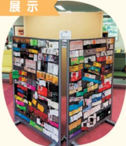
本の「帯」を紹介する、もっ帯(たい)ない展

普段の成果を見せたいけれど、展示会場を借りるのはちょっと……、という人は、ここから始めてみるのもいいかもしれません。