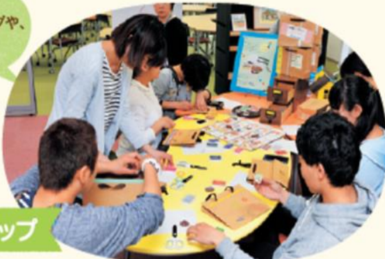
紙袋ワークショップ