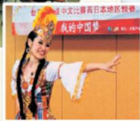
世界大学生 中国語コンテスト社行会

留学体験発表会や、世界の言語を紹介する講座、語学コンテスト社行会、ビブリオバトルなどのイベント会場としても使っています。