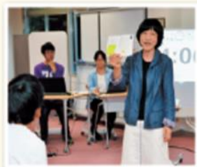
ビブリオバトル 教員編