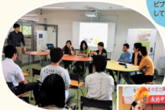
留学生と語る 「スマホと世界/スマホの世界」

留学体験発表会や、世界の言語を紹介する講座、語学コンテスト社行会、ビブリオバトルなどのイベント会場としても使っています。