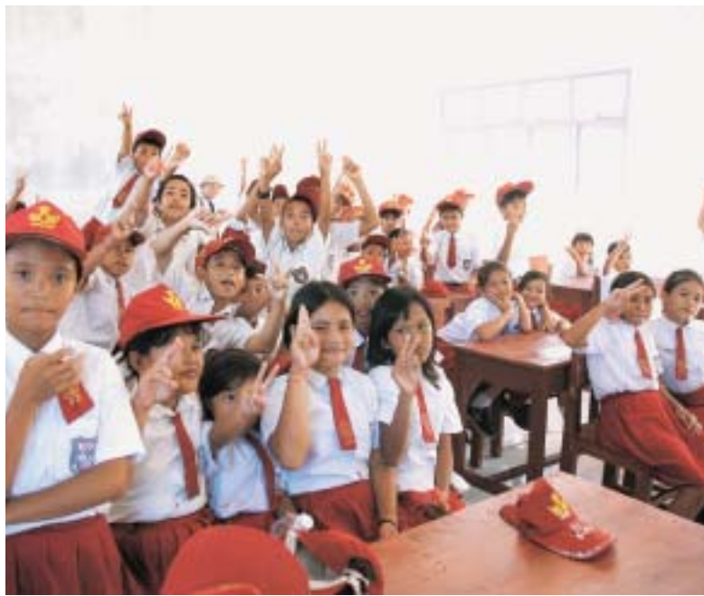
本学ニアス島復興支援委員会などはインドネシアで、また、地域文化研究センターはフィリピンで、復興支援活動などを実施した。写真は新しい校舎・机・イスを喜ぶ、モアウオ小学校の児童。

つづ、入試部が個別相談会を、つづ、入試部が個別相談会を、つづ、入試部が個別相談会を