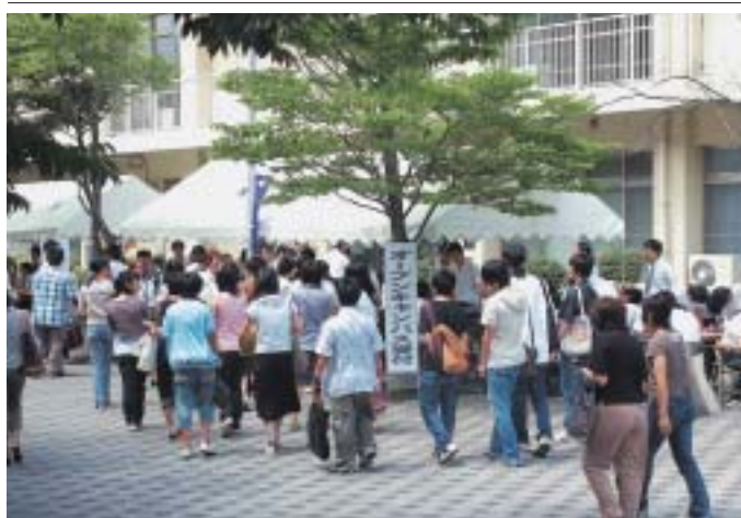
多数の来場者でにぎわう受付

海外からの来訪者 7月10日、プエブラ栄誉州立自治大学(メキシコ)のエンリケ・アグエラ・イバニエス学長一行9人が、7月26日、台湾大学の梅家玲台湾文学研究所教授ら一行8人が、8月21日、トリパン大学(ネパール)のマンガル・ジャーキヤンバスターフが、9月12日、台湾大学の柯慶明台湾文学研究所長一行4人が、