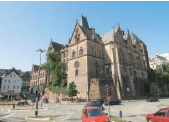
マールブルク大学の神学部校舎

の概念とその意味が批判的に再検討された。3つの基調講演の後、9つの個別テーマに沿って、掘り下げた討議が行われた。具体的には、天理教をはじめ、キリスト教、イスラム、仏教などの世界の宗教における「祈り」の諸現象や、現代社会における宗教性と「祈り」の関わりなど、「祈り」のテーマが様々な角度から取り上げられ、現代世界における「祈り」の意味と構造に関する討議が展開された。