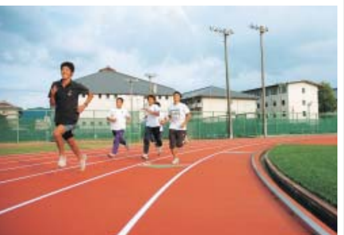
鮮やかなオレンジ色に生まれ変わったトラックを試走する陸上競技部の学生たち

竣工式の後、陸上競技部の学生たちが鮮やかなオレンジ色に生まれ変わったトラックを試走する様子。