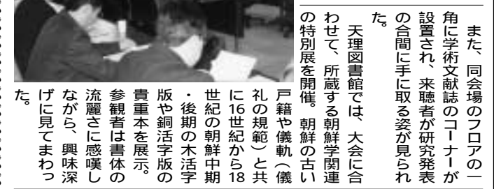
また、同会場のフロアの一角に学術文献誌のコーナーが設置され、来聴者が研究発表の合間に手に取る姿が見られた。

研究発表会では第1部門「語学分野」、第2部門「文学分野」、第3部門「歴史学・民族学・考古学・その他の分野」を授与された。