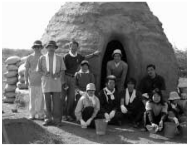
今年3月には学生7人が参加。後ろに見えるのがボンガで、今年2つ目を作った

「国際参加プロジェクト」インド西部地震救援復興活動」は、2001年の夏に、インド西部のグジャラート州ジャムナガル地方で発生した大地震の救援復興活動を本学教職員・学生や天理教海外部員等で第1回目を行い、2002年3月に第2回目を実施し、今年度も同プロジェクトを3年度続けて実施することになった。