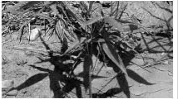
カブール大学に「竹」根づく

参加募集は10月31日まで行われる。一次と二次の募集期間がある。応募や申込等の問合せは地域文化研究センター(電話0743-63-9077)、教育支援部(電話0743-63-9008)へ。